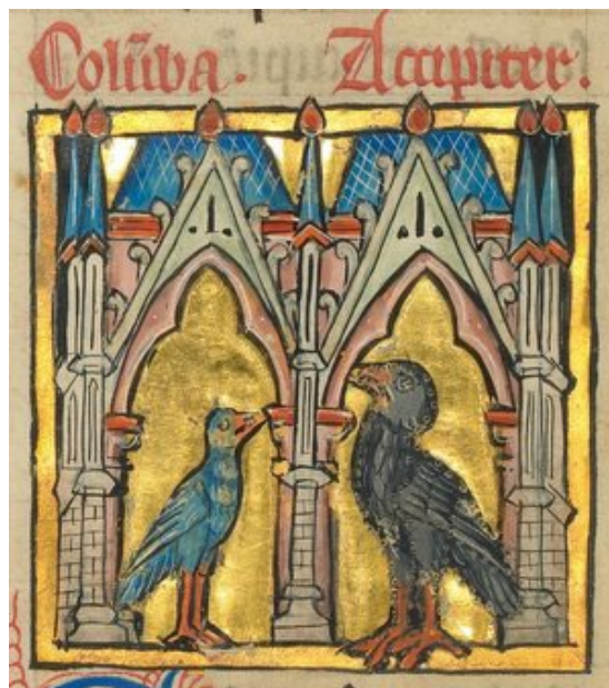
Uma pomba e um falcão (detalhe), Ms. Ludwig XV 4 (França, último quartel do século XIII), fol. 1v. The J. Paul Getty Museum, Los Angeles

Um caso curioso — que emerge precisamente na senda dos esforços tratadísticos ( Etimologias ) ou mais especulativos ( Fisiólogo ) citados — é o interesse reiterado por aves, cujo protótipo é o Livro das Aves ( De avibus ; o título varia consoante as fontes), um tópico com uma tradição bem mais antiga; aliás, basta recordar os longevos interesses greco-romanos pela adivinhação e os atributos premonitórios imputados à visão de