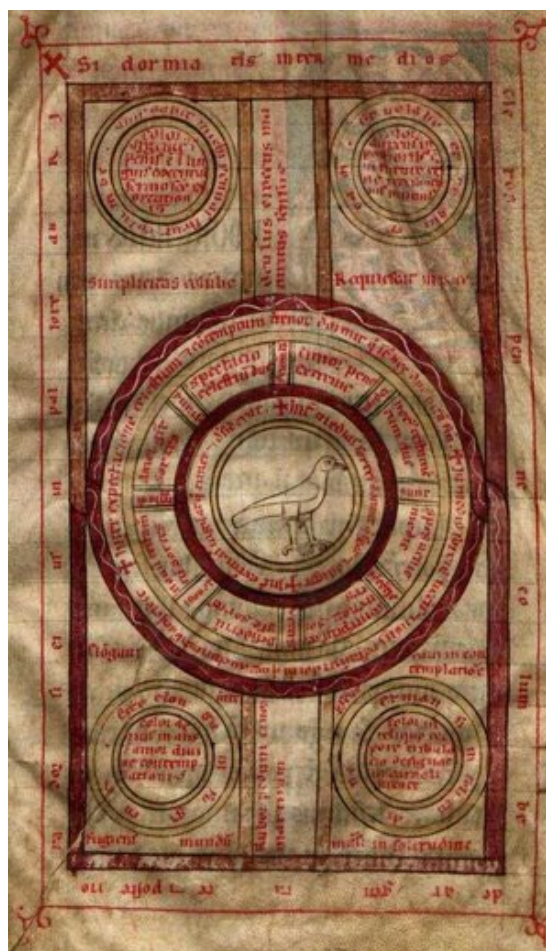
Diagrama da pomba, Ordem de Cister, Mosteiro de Lorvão, códice 5 [cota antiga: ms. 90] (Lorvão, 1184), fol. 3r. Arquivo Nacional Torre do Tombo.