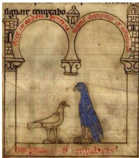
Uma pomba e um falcão (detalhe), Ordem de Cister, Mosteiro de Lorvão, códice 5 [cota antiga: ms. 90] (Lorvão, 1184), fol. 2r. Arquivo Nacional Torre do Tombo.

aves e, em particular, ao exame das suas vísceras. Este aviário — i.e., este livro peculiar sobre aves — foi escrito no primeiro quartel do século XII por um cânone agostinho, de seu nome Hugo de Folieto (Fouilloy), e destinava-se ao contexto