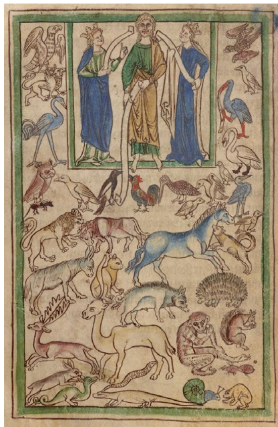
Adão nomeando os animais, Bestiário Northumberland (Inglaterra, c. 1250-60), ms. 100, fol. 5v. The J. Paul Getty Museum, Los Angeles

O que é curioso no «pensar com » (espécies) é a associação do verbo a um complemento de companhia, o vínculo que na expressão mencionada transparece entre o pensar e o objecto do pensamento, a transitividade de uma actividade cuja ideação típica é solitária, abstracta e tendencialmente universal e que, pelo contrário, surge aqui acompanhada, versando particulares.