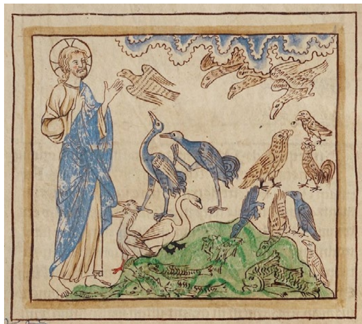
A criação das aves e dos peixes (detalhe), Bestiário Northumberland (Inglaterra, c. 1250-60), ms. 100, fol. 3r. The J. Paul Getty Museum, Los Angeles

Quando se fala de pássaros há, portanto, uma diferença (entre muitas possíveis) que importa assinalar para perceber outras coisas que sobre eles são ditas: não estão confinados à terra, mas